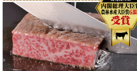
『鹿児島黒牛ステーキ』 1,000円